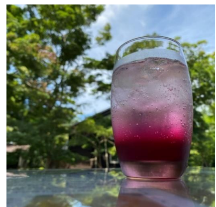
写真 もみじソーダ